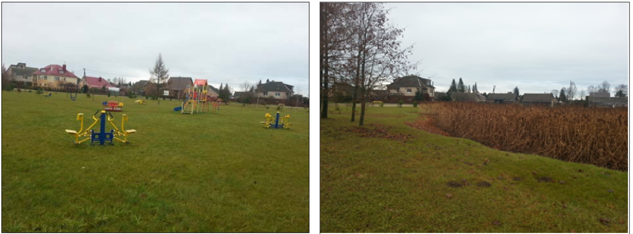
2 pav. Satkūnų kaimo skvero prie tvenkinio teritorija (tvenkinio krantas, lauko treniruokliai su vaikų žaidimo aikštele)

1) Satkūnų kaimo skveras yra pačiame kaimo viduryje, šalia tvenkinio ir užima apie 1,90 ha ploto teritoriją. Seniūnija kartu su Satkūnų kaimo bendruomene puoselėja skverą, jame sodina retesnius augalus, įrengė alpinariumą, šienauja žolę, prižiūri augalus. Bendruomenė nupirko ir pastatė lauko treniruoklius su vaikų žaidimų aikštele. Skveras pasidarė satkūniečių ir jų svečių mėgiama laisvalaikio vieta. Tačiau kaimo gyventojams iškilo problema su maudymosi vietomis. Šalia skvero esantis tvenkinys priaugęs nendrių ir visiškai netinkamas maudytis. Satkūnų seniūnijoje nėra tvenkinio tinkamo maudytis. Išvalytas, sutvarkytas ir paruoštas maudymuisi tvenkinys išspręstų satkūniečių socialines problemas, kadangi ne visi išgali nuvažiuoti prie jūros ar ežerų.