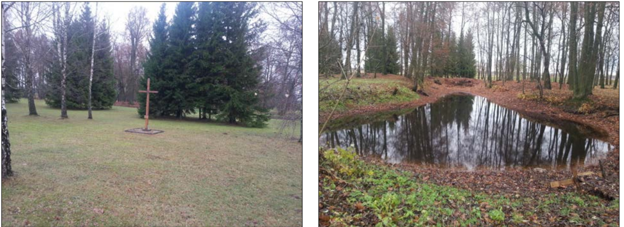
3 pav. Satkūnų kaimo parko teritorija (kryžius ir parko tvenkinys)

Satkūnų kaimo parko viešosios erdvės teritorija turi tapti gyventojų ir atvykusių svečių reprezentacinė, bendravimo ir poilsio erdvė. Todėl būtinas parko sutvarkymas, takelio nutiesimas iki kryžiaus, šalia takelio tikslinga įrengti suoliukus su šiukšliadėžėmis, kad atvykę žmonės turėtų kur pasėdėti, pailsėti. Taip pat kaimo parkas yra šalia bendruomenės namų, kuriame dažnai rengiamos gegužinės, švenčiamos Joninės ir Petrinės. Išvalytas tvenkinukas suteiktų parkui žavesio, kuriame būtų galima pailsėti šimtamečių medžių paunksmėje, rengti šventes. Šalia tvenkinio siūloma įrengti du suoliukus su šiukšliadėže (žr. Projekto preliminarios žemės konsolidacijos projekto teritorijos viešosios erdvės ir viešosios infrastruktūros sutvarkymo projektiniame pasiūlyme M 1:2 500 pažymėtas Nr. 2 ).