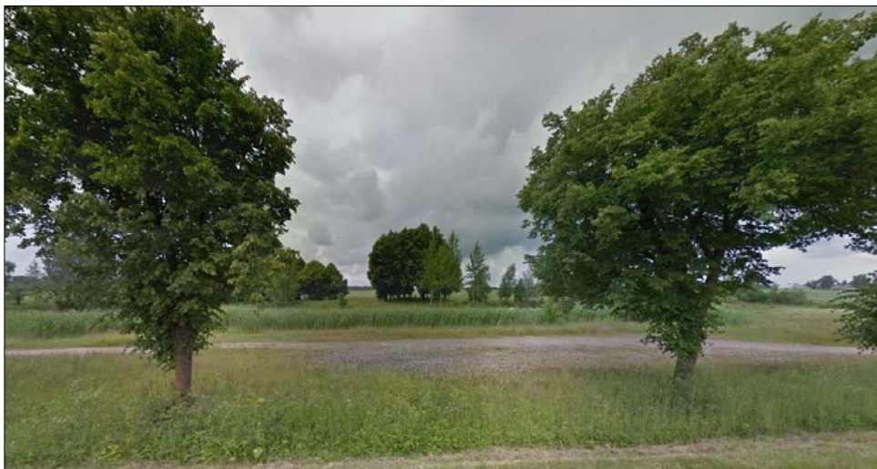
4 pav. Pročiūnų I kaimo teritorija prie tvenkinio

3) Pročiūnų I kaimo teritorija prie tvenkinio, kuri užima apie 1,0 ha. Numatomi darbai: išvalyti, sutvirtinti tvenkinio pakrantę, įrengti lieptelį ir maudyklą, pastatyti du suoliukus su šiukšliadėže (žr. Projekto preliminarios žemės konsolidacijos projekto teritorijos viešosios erdvės ir viešosios infrastruktūros sutvarkymo projektinis pasiūlymas M 1:1 500, pridedama ).